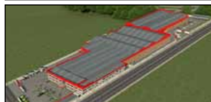
Sede Tramontini em Venâncio Aires/RS