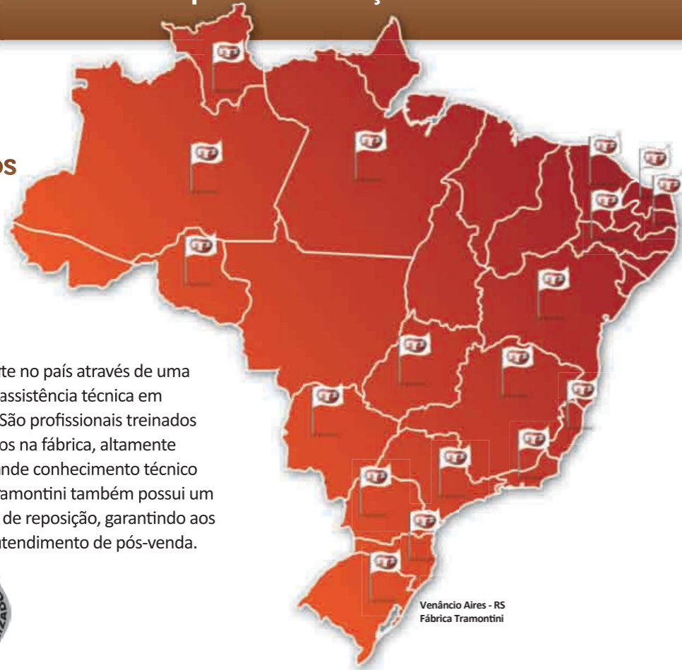
Venâncio Aires - RS Fábrica Tramontini